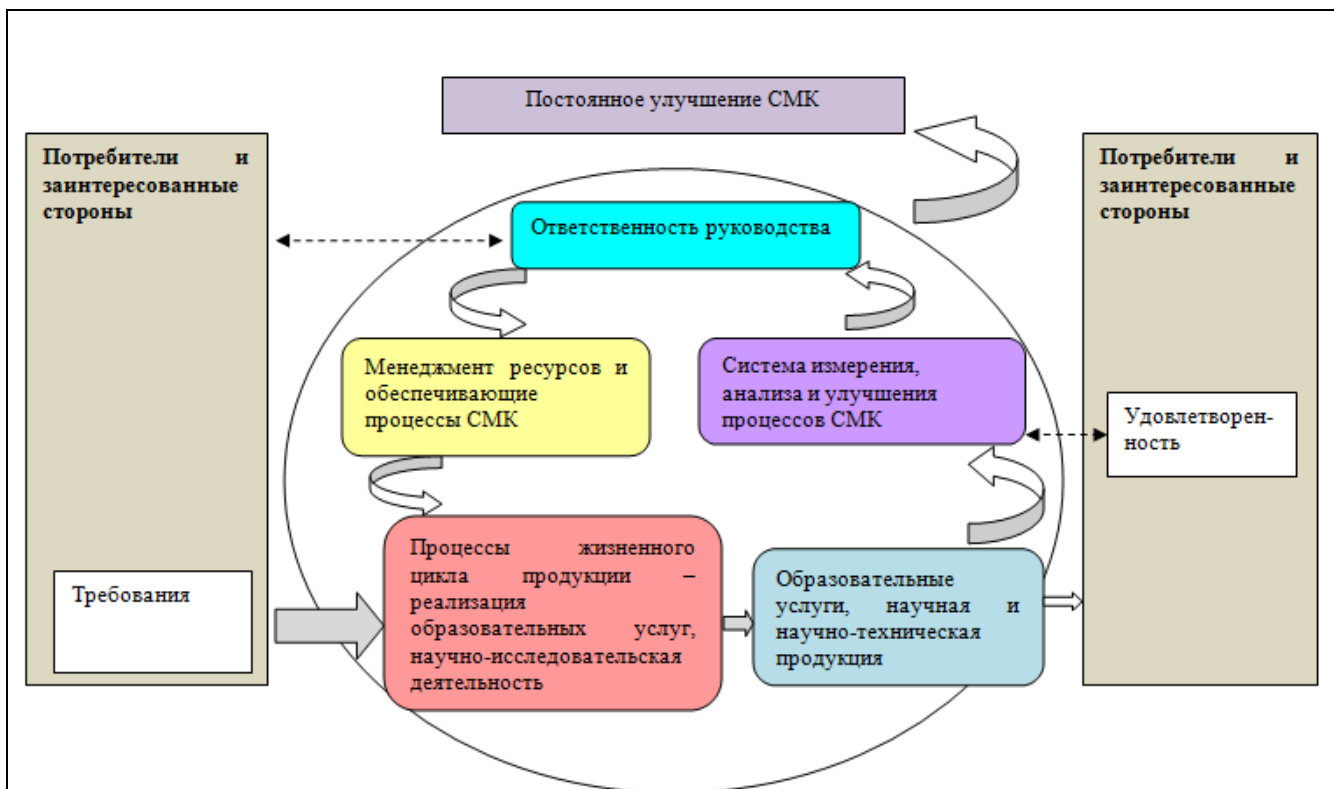
Рис. 1. Модель системы менеджмента качества ФГБОУ ВО «БрГУ»