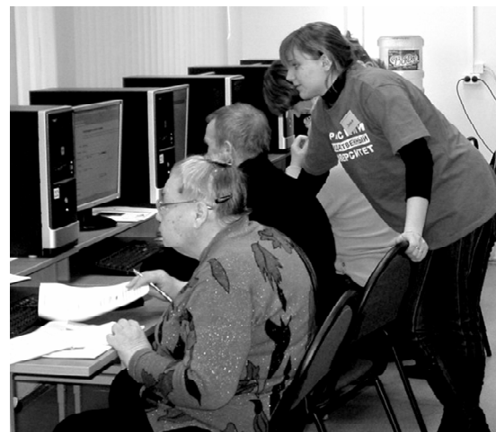
Студенты-волонтеры помогли ветеранам.