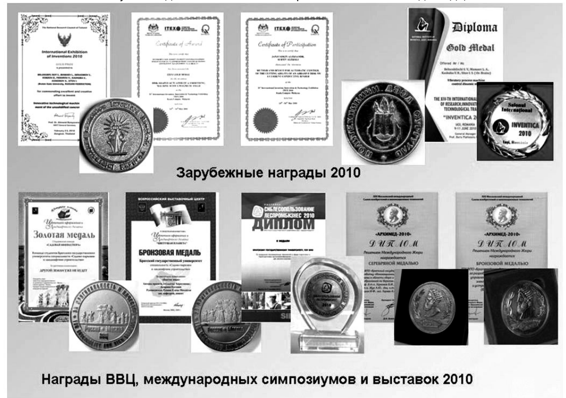
Зарубежные награды 2010

Научная деятельность является неременной составной частью образовательного процесса. Научно-исследовательской работой охвачены более 80 % студентов университета очного обучения. Только в 2010 г. студентами опубликованы 1121 статья, в том числе 722 без соавторов преподавателей, выполнено 534 доклада, в том числе 213 на