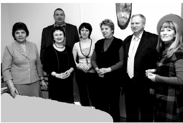
Бюро расписаний: и хорошее настроение не покинет больше нас!

- В этом помещении и наша кафедра находится почти 25 лет, были косметические ремонты, но ка-