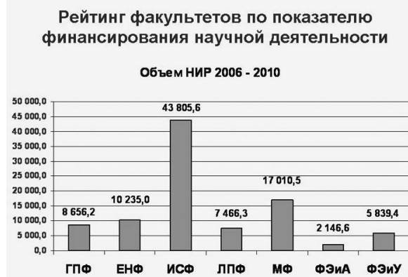
Рис. 7. (Тыс. руб.)

тинговых научных изданиях, имеющих высокий импакт фактор российского и международного индекса научного цитирования; издано 136 (32) сборника научных трудов. Сотрудники БрГУ принимали участие в 436 (132) конференциях, в том числе 211 (71) международных, на базе университета проведено 115 (29) конференций различного уровня, включая международные и всероссийские. Подано 248 (73) заявок на изобретения, получено 200 (49) патентов, в том числе 156 поддерживается, зарегистрировано 66 (21) программ для ЭВМ. За последние 5 лет в среднем за год издавалось 8,3 монографии в расчете на 100 основных штатных педагогических работников с учеными степенями и (или) званиями. По этому критериальному показателю Братский государственный университет находится в центральной зоне выборки из 366 российских университетов. Рейтинг факультетов по показателям научно-технической продукции приведен на рис. 8 и 9.